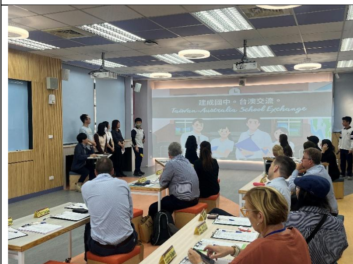
澳洲校長參訪團學生擔任英語導覽解說員