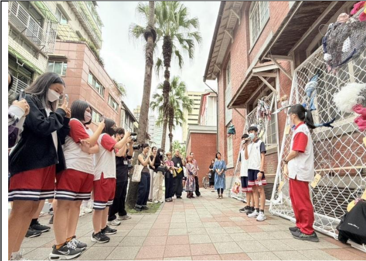
館校合作於當代館和建成國中周邊街區展出