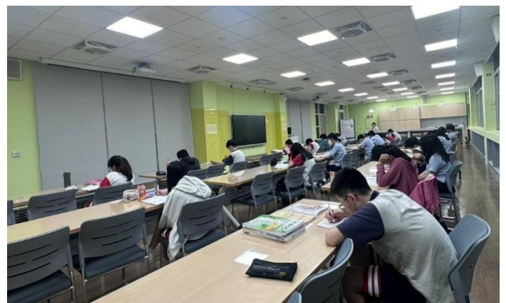
九年級夜自習-靜心留讀·築夢踏實