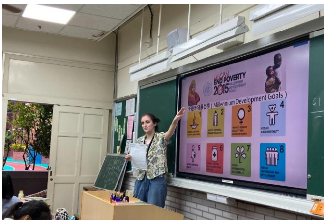
雙語教育外師協同教學