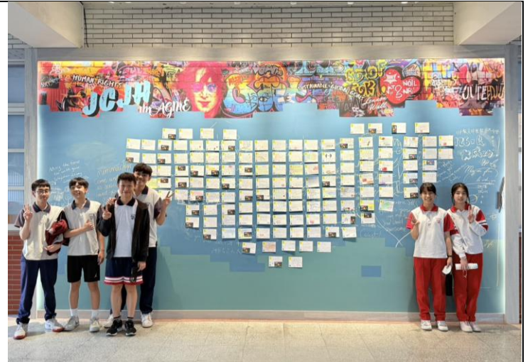
【彈性課程-全球議題】 | 藍儂牆與人權明信片