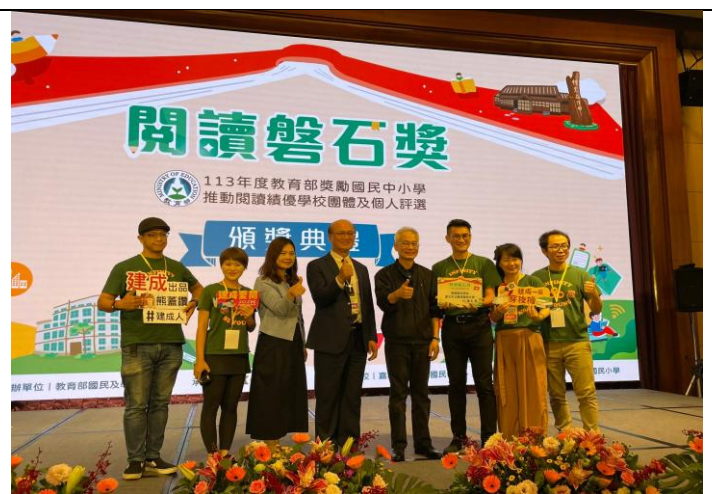
113年閱讀磐石獎授獎