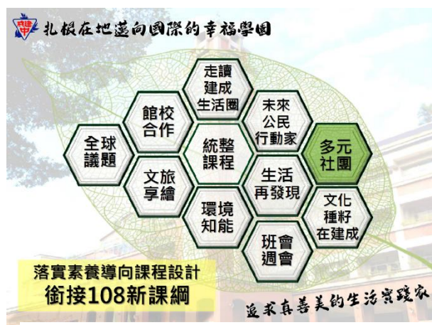
本校彈性課程發展