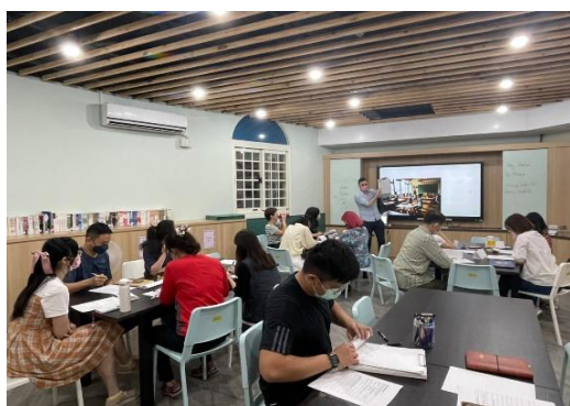
參與雙語社群課程