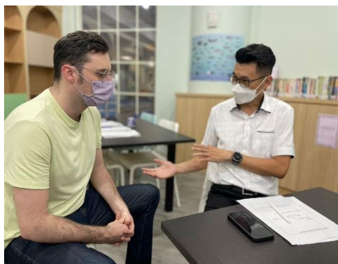
與外籍教師對話練習