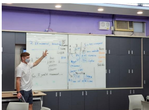
外籍教師教授雙語課程的基本要點