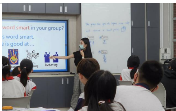
學生能跟著教師複述雙語關鍵字任務