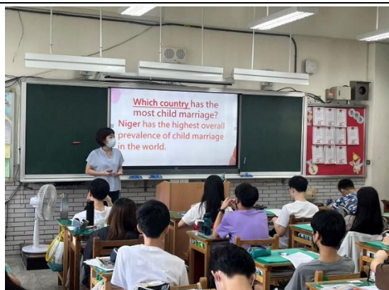
教師引導學生進行4F 策略紀錄