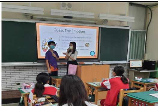
學生能上臺以英語句型表達情緒