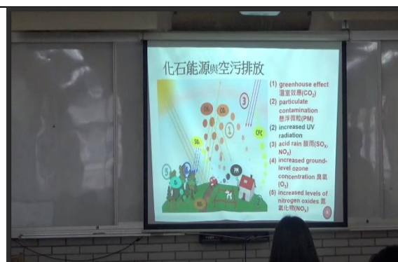
教師說明包含語文重點及學科內容