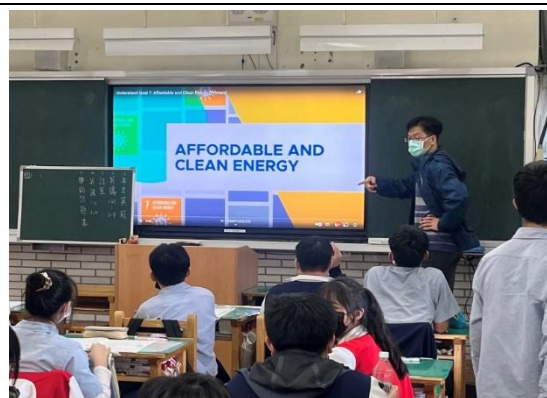
學生能發表 SDGS icon 設計理念與原因