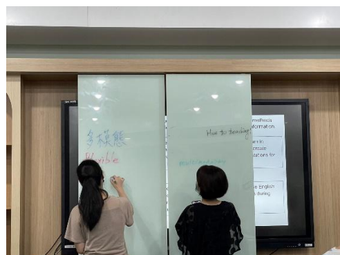
多模態課程內容構成的教學元素