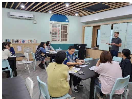
外籍教師教授英語會話及聽力課程