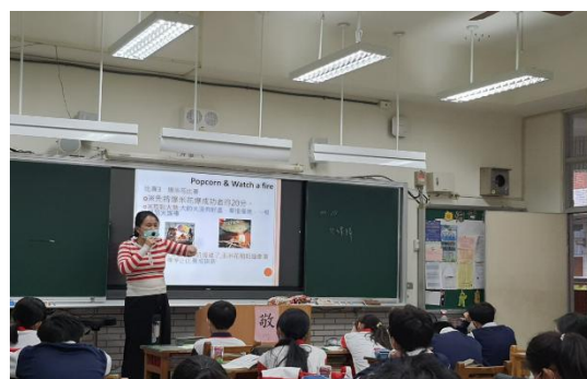
教師引導學生以英語關鍵字與同儕討論