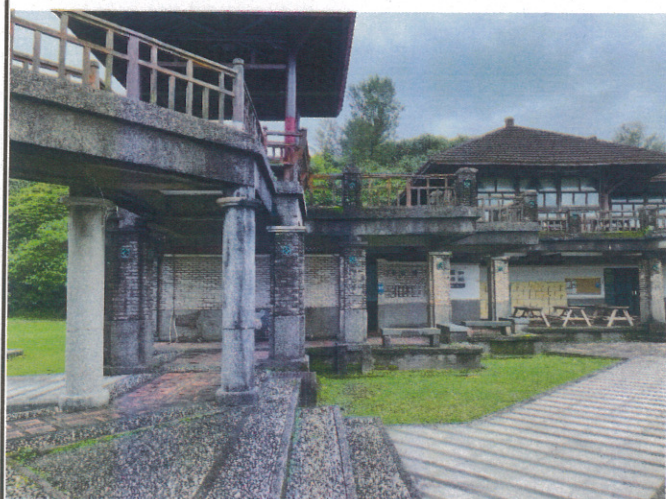
龍門獨行天下活動場地勘查