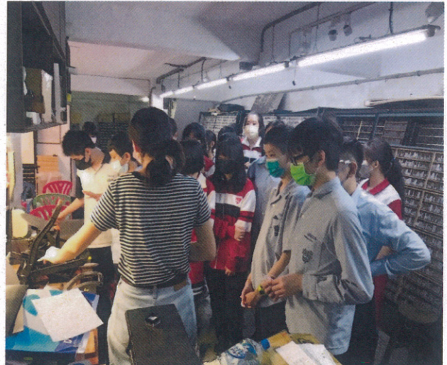
講解並進行印刷手作