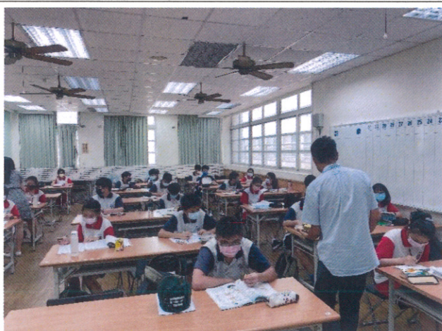
校長勉勵同學，發金莎