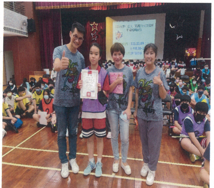
建成國中榮獲冠軍