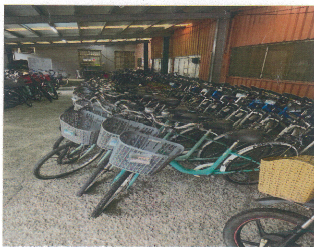
福隆自行車設備確認