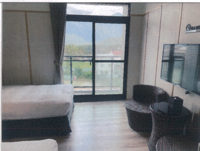
范特奇堡學生學生房間勘驗