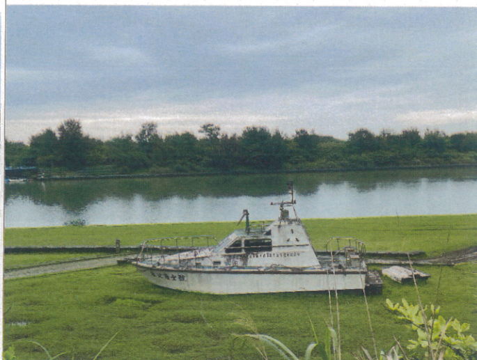
獨木舟划行路線確認