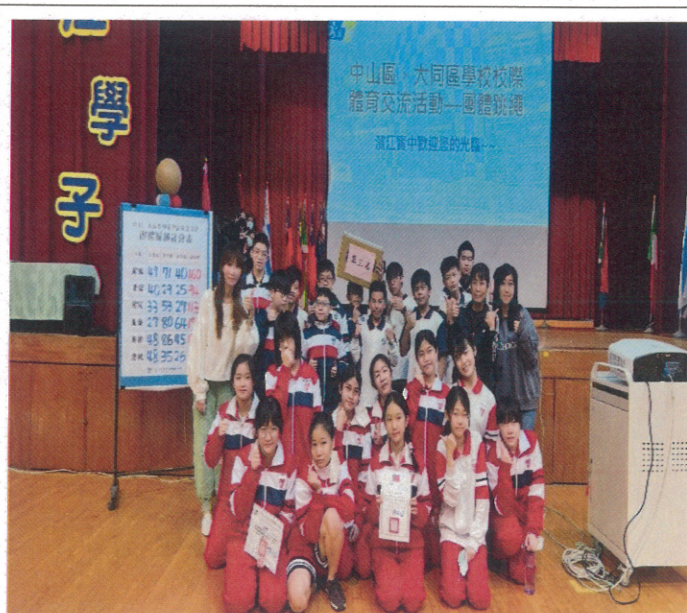
建成國中榮獲第三名