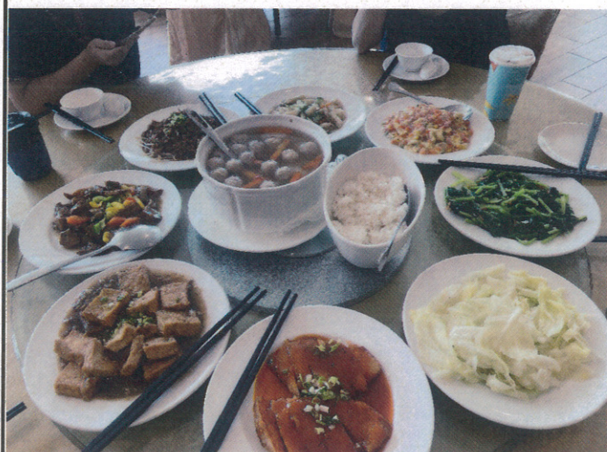
范特奇堡學生畢旅餐點勘驗