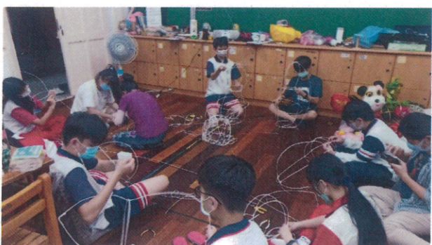
學生製作花燈骨架