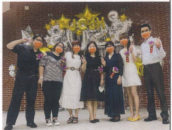
九年級導師拍照區合影