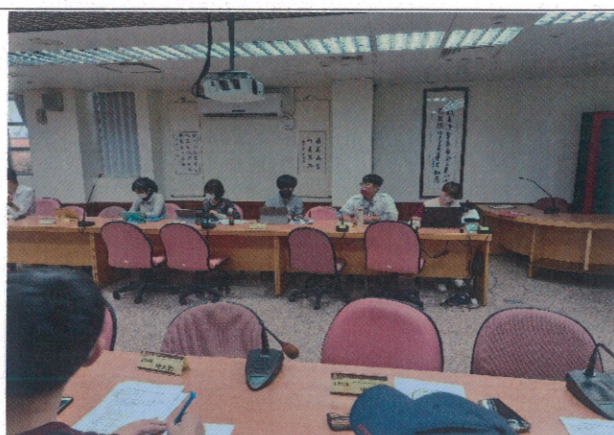
學務主任準備簡報