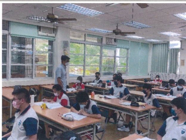
校長勉勵同學，發金莎