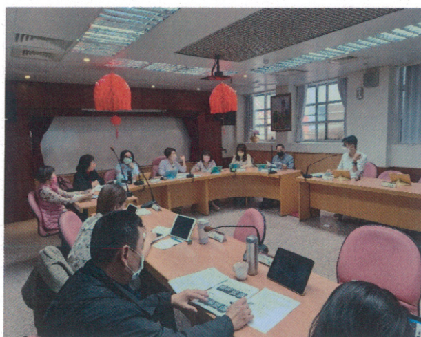
校長述說進行情形