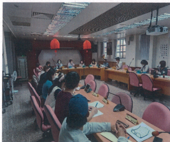
訪視委員提供意見