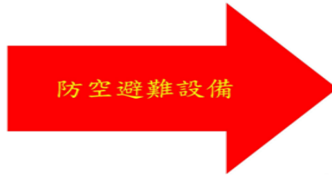
地下室避難集合配置圖