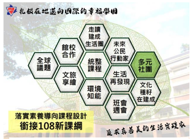
本校彈性課程發展