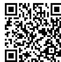
親子帳號綁定操作指引

為讓家長以最便捷的方式取得臺北市政府教育局所提供親師生校園 E 化服務，例如：學雜費繳款、社團活動報名、到離校資訊、線上請假、公布欄、調查表、班級通知事項及臺北酷課雲（親師生學習整合平臺）等。家長需以校務行政系統親子綁定之信箱，作為開通帳號，俾能使用相關系統。