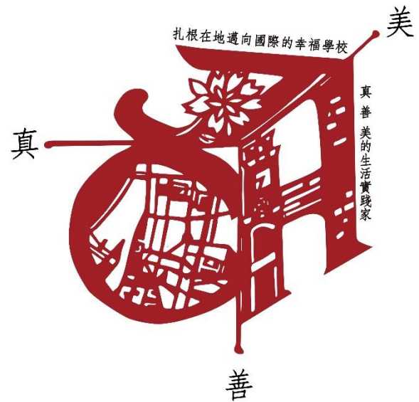
學校願景：「扎根在地邁向國際的幸福學校」

為了培養學生的學習興趣，本校提供良好的學習環境，提供師生充足的閱讀資源，已於 109 年度暑假完成圖書館整修，整建完成的圖書館不再只是安靜讀書的場域，而是校園的讀寫討論中心，除了辦理學生學習活動與規畫教師增能研習，更是課程推動的引擎。