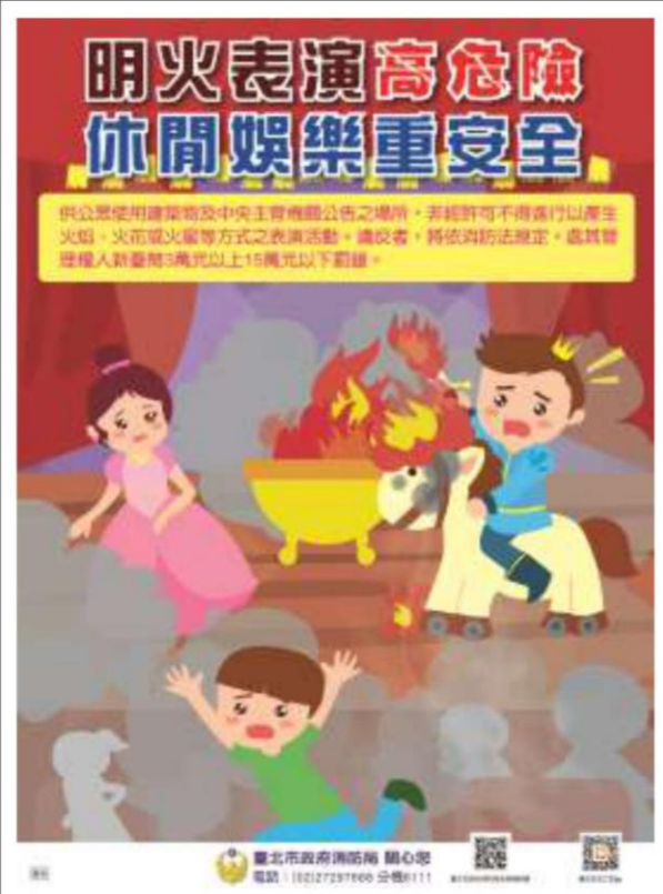
明火表演宣導海報