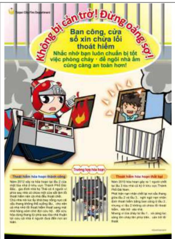
越南語-無阻礙不慌張(鐵窗預留開口)