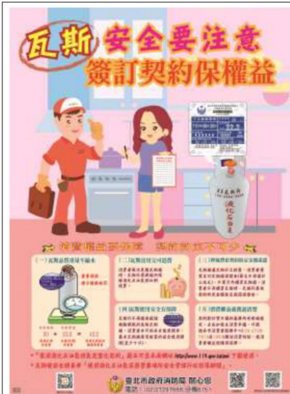
瓦斯安全宣傳海報