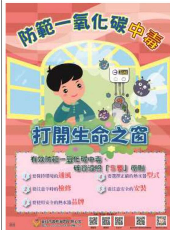
防範一氧化碳中毒宣傳海報