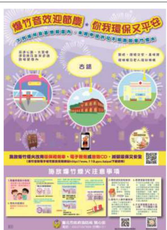
爆竹煙火安全宣傳海報