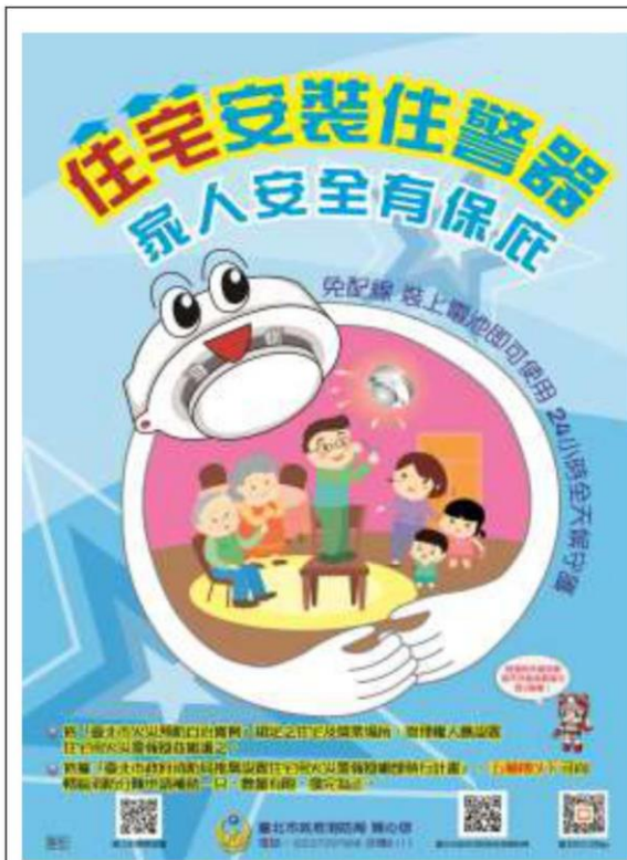
裝置住宅用火災警報器海報