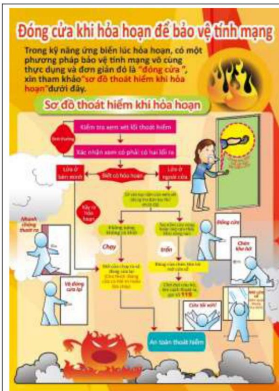
越南語-無阻礙不慌張(關門保命)