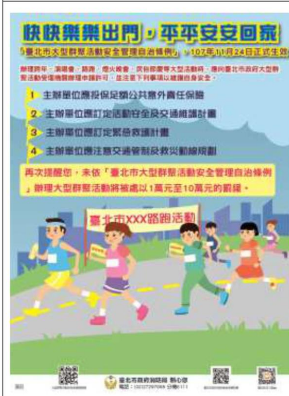
大型活動宣傳海報