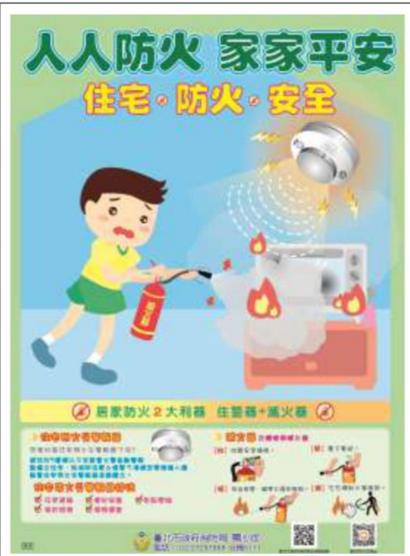
住宅防火安全海報