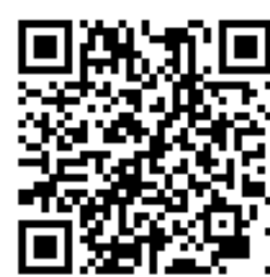
北教大學術單位聯繫方式